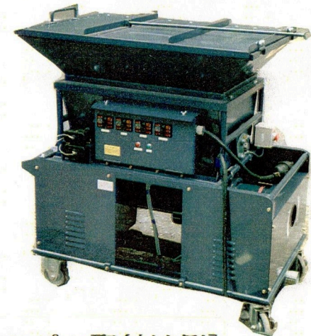
[特殊ホッパー取付け例]